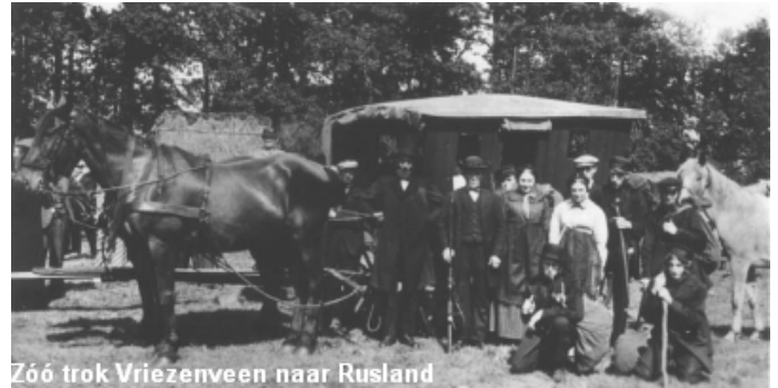
Rusluie met de koets, waarmee men naar Rusland trok.

“Ik heb dit nooit eerder zo gedaan; ik hoop dat jullie het mooi hebben gevonden”, liet Poortier nog aan het eind weten en wijzend op de modeshow met levende paspoppen. Gezien het applaus van de zaal was deze historische modeshow goed in de smaak.